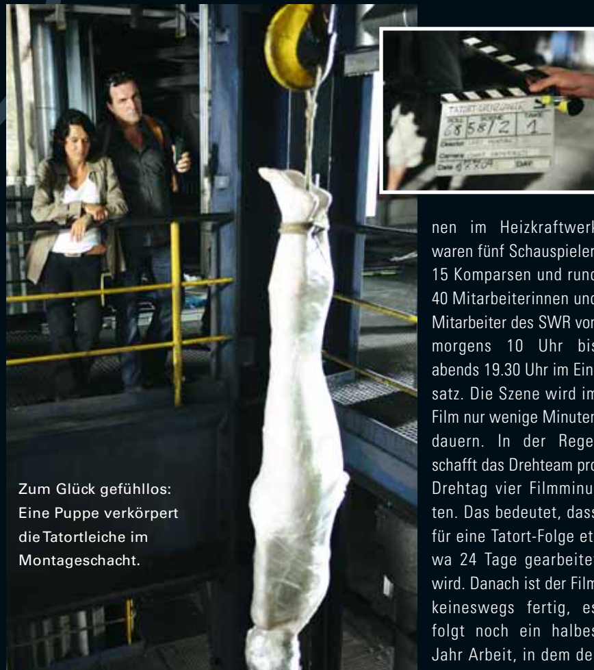
Zum Glück gefühllos: Eine Puppe verkörpert die Tatortleiche im Montageschacht.

Am 22. August um 20.15 Uhr ermittelt Ulrike Folkerts zum 50. Mal als Kommissarin Lena Odenthal. In der Ludwigshafener „Tatort“-Folge „Hauch des Todes“ hat das Stadtwerke-Heizkraftwerk am Rheinhafen seinen großen Auftritt als Leichen-Fundort.